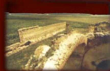
Vedere de pe ruinele bisericii spre altar si spre o latura de chilia <<<