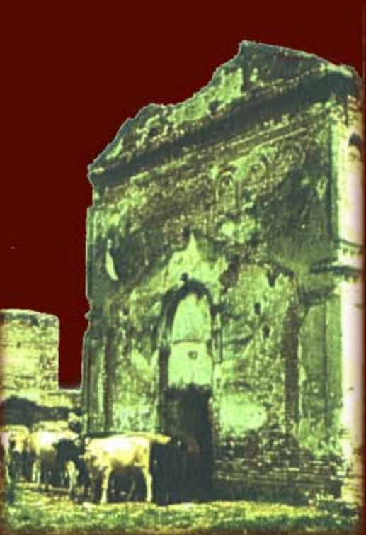
Situatia manastirii in 1991 <<< >>>

Datorita izolarii amplasamentului si parasirii ei dupa anii '50, manastirea a intrat intr-un lent dar necrutator proces de degradare, la care a contribuit din pacate si lipsa de interes a localnicilor. Graitoare in acest sens, sunt imaginile de mai jos realizate in 1991, cand ansamblul devenise salasul vitelor din satele invecinate