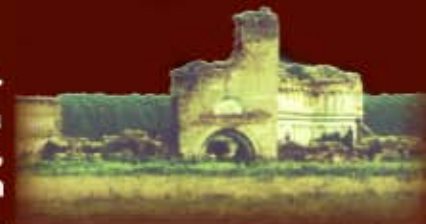
>>> Ansamblul asa cum arata azi, iesind parca din negura vremurilor...