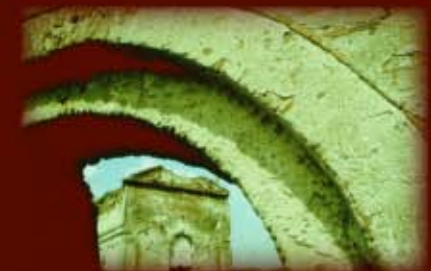
Biserica vazuta prin gangul de intrare al turnului clopotnita <<<