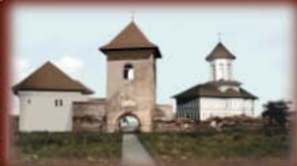
>>> ...si asa cum va arata daca vor exista fonduri suficiente pentru restaurare