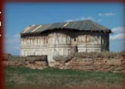
>>> Biserica asa cum arata azi...