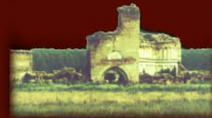
Ansamblul, privit din exterior acum cativa ani <<<