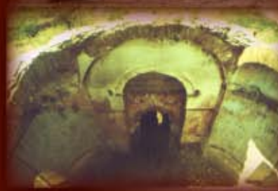
AAA Stand pe fostul tambur al turlei, privind spre pronaos