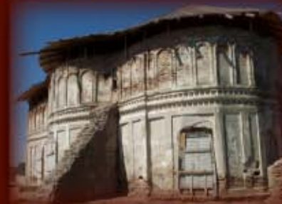
<<< Absida altarului vazuta dinspre est