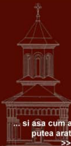
... si asa cum ar putea arata >>>