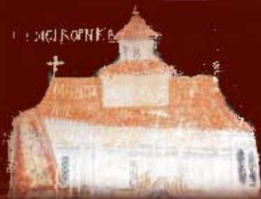
<<< Biserica, asa cum apare pe tabloul votiv