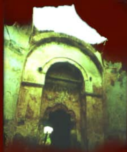
<<< Vedere din "interiorul" bisericii, dinspre naos spre pronaos